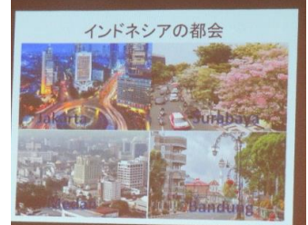
インドネシアの都会